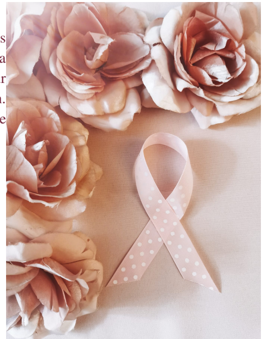
Lola Lemire 4èmeB