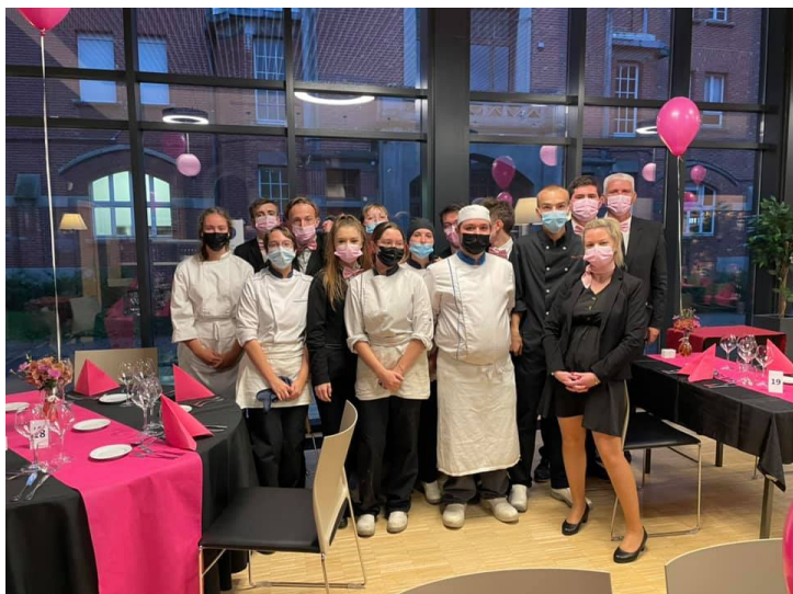
Soirée au profit de la recherche du cancer avec nos élèves de la section hôtellerie restauration.